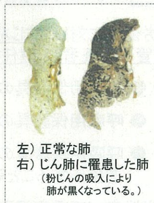
左) 正常な肺 右) じん肺に罹患した肺 (粉じんの吸入により肺が黒くなっている。)

現在、じん肺を治す根本的な治療がないため、じん肺にかからないための措置として、粉じんの発生源対策、局所排気装置等の適正な稼働、呼吸用保護具の適正な着用などにより、粉じんへの「ばく露防止対策」を徹底することが重要です。