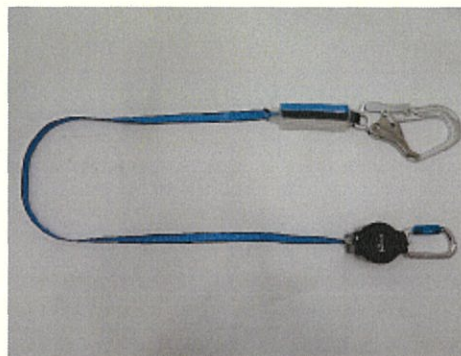
ランヤード全体 (巻取器からストラップを全て出した状態)