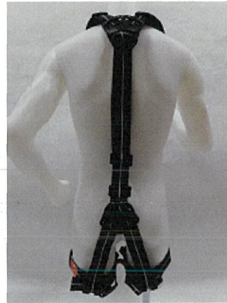
フルハーネス全体（後側）