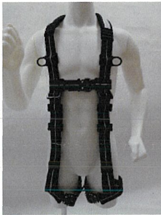
フルハーネス全体（前側）